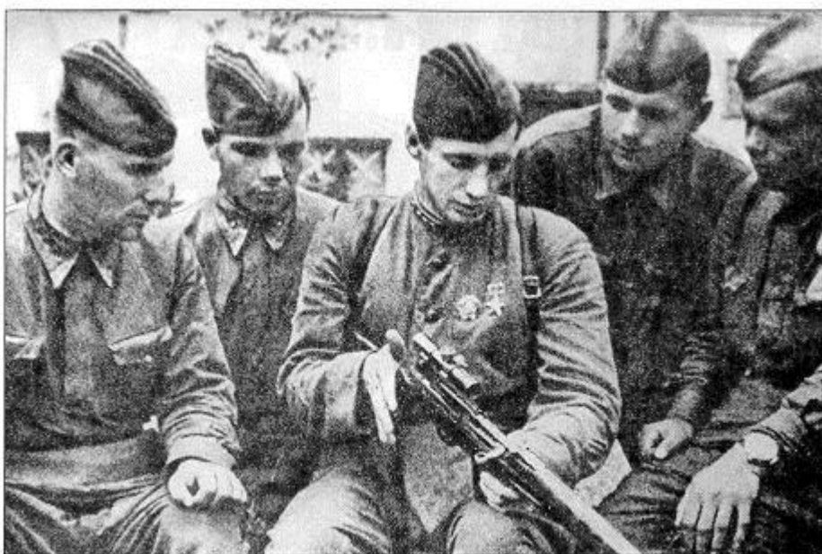
Герой Советского Союза В. Пчелинцев рассказывает бойцам о своих приемах снайперской стрельбы.

Перед Великой Отечественной войной подготовку в ОСОАВИАХИМ прошли до 80% военнослужащих сухопутных войск и флота и до 100% авиации. В 1938 году в одном из писем Сталин писал: «...Нужно весь наш народ держать в состоянии мобилизационной готовности перед лицом опасности военного нападения, чтобы никакая „случайность“ и никакие фокусы наших внешних врагов не могли застигнуть нас врасплох...».