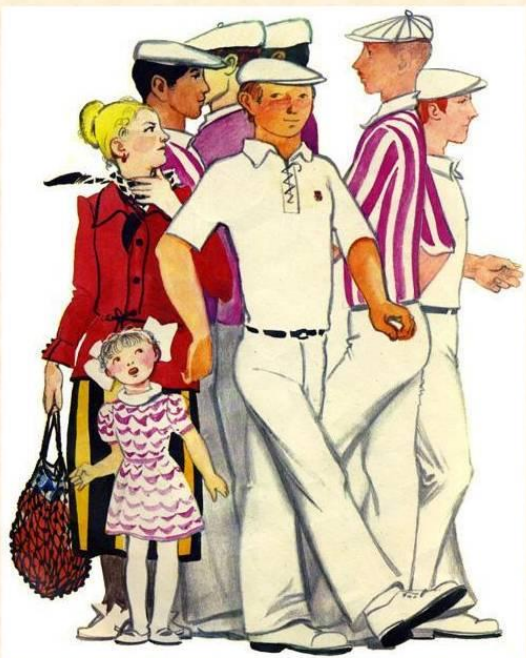
Знак ГТО на груди у него